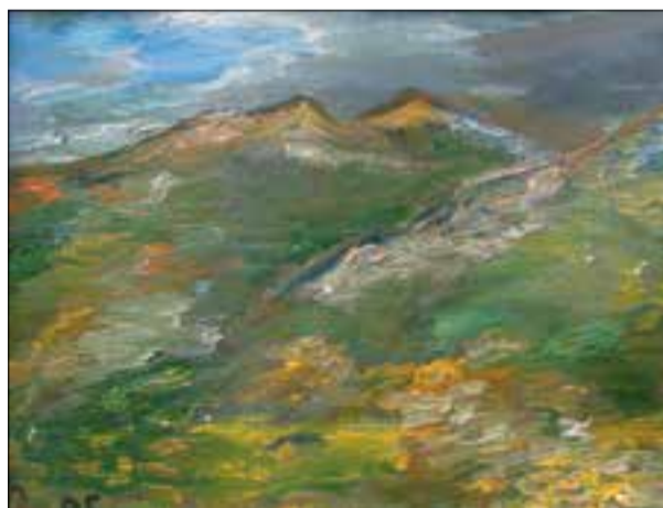
Ղ. Կամոյան, Խուսափուփի սփորոքի