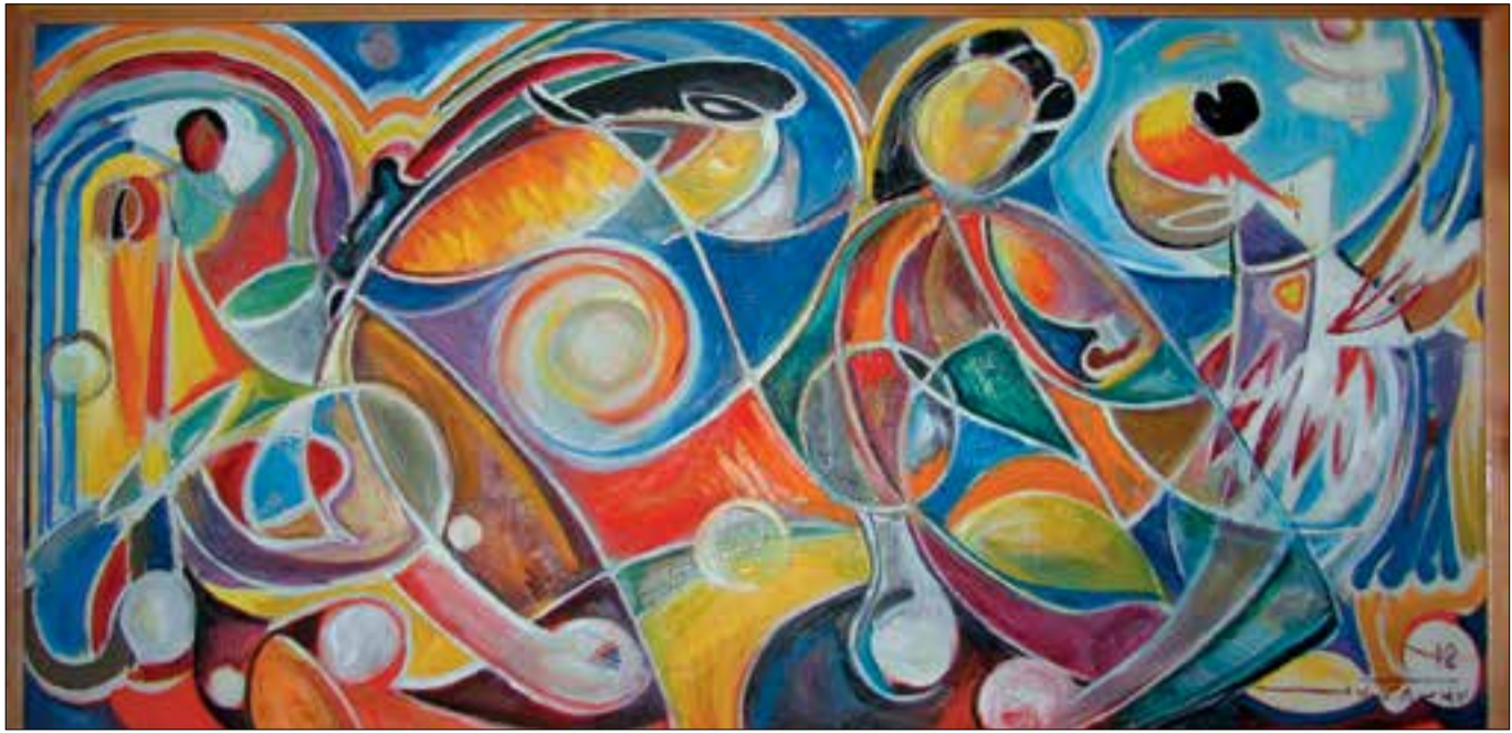
Երկնային երաժշտություն, 120 x 80, կր. յուղ., 2011թ.