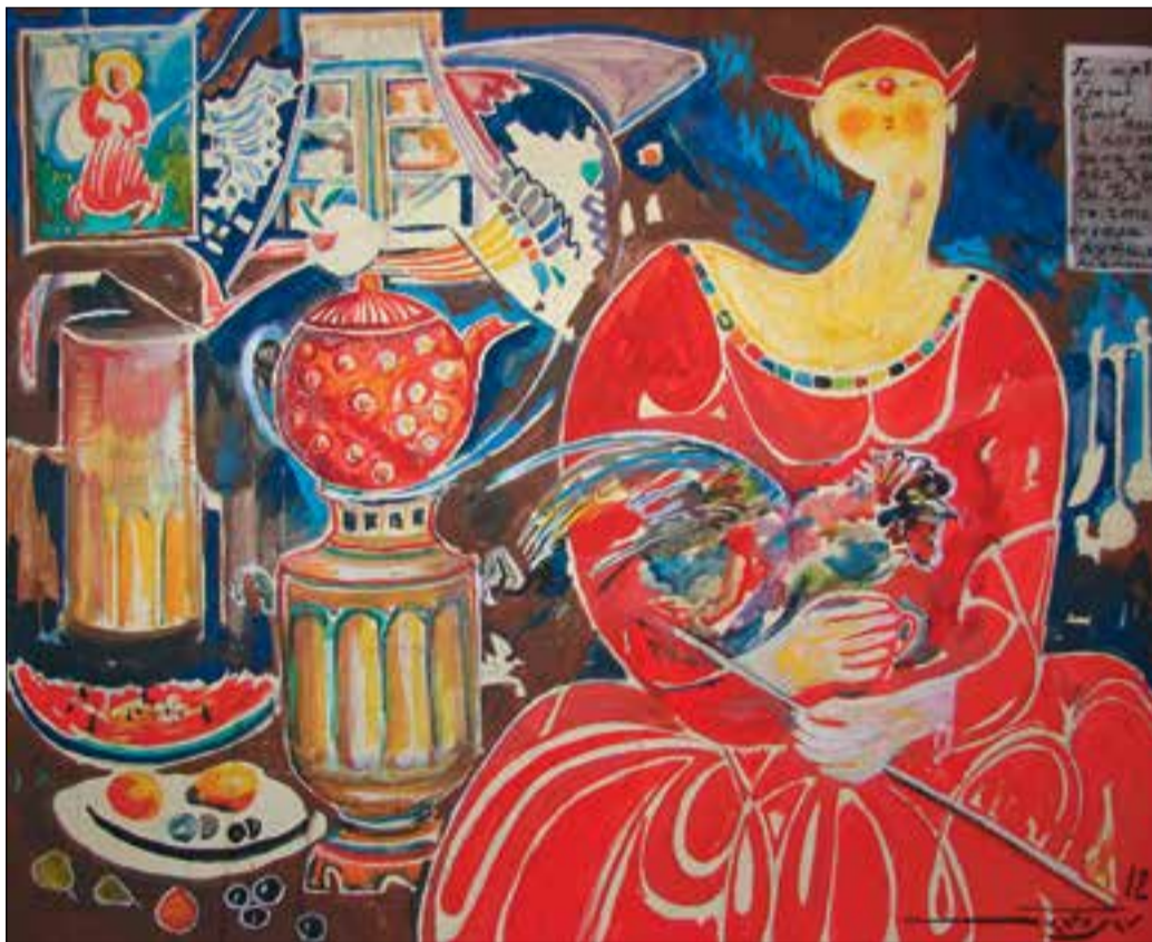
Մաքրյոնա Սիբիրից, 80 x 60, կգ. յուղ., 2010թ.