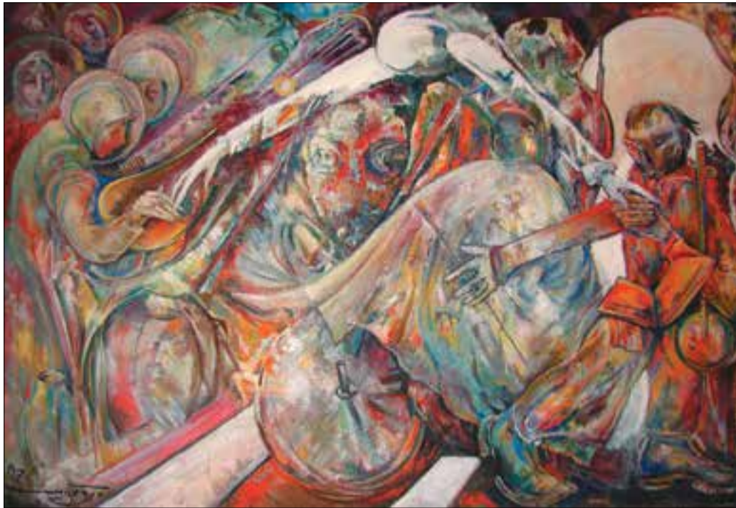
Նադաշ Հովնաթանի մանկությունը, 200 x 100, կգ. յուղ., 2009թ.