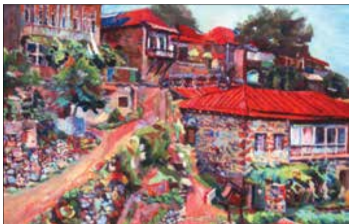
Լ. Կամոյան, Վաչագան