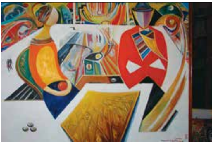
Տամա, 80 x 60, կր. յուղ., 2010թ.