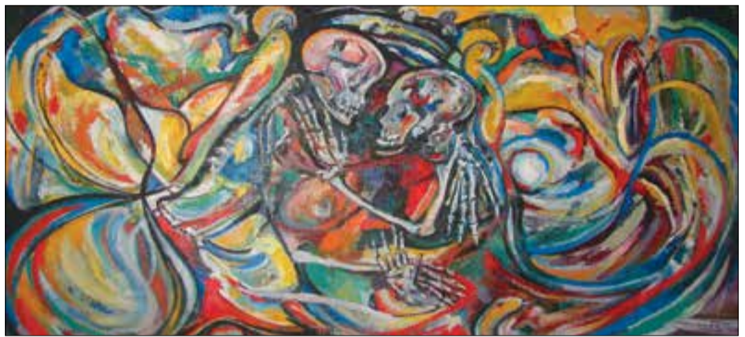
Սեր մահից հետո, 200 x 100, կր. յուղ., 2010թ.