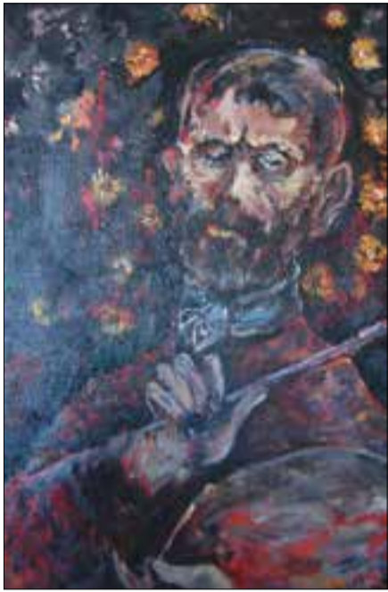
Ինքնանկար, 80 x 60, կր. յուղ., 1970թ.