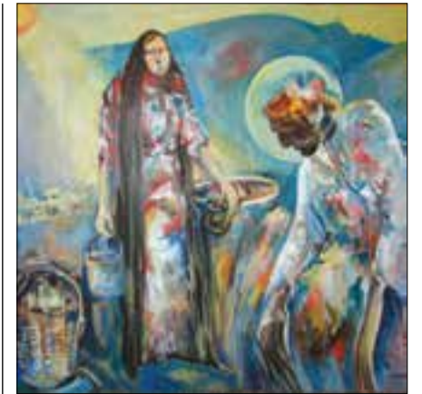
Քրիստոսը եւ Սամարացի կինը, 100 x 80, կգ. յուղ., 2010թ.